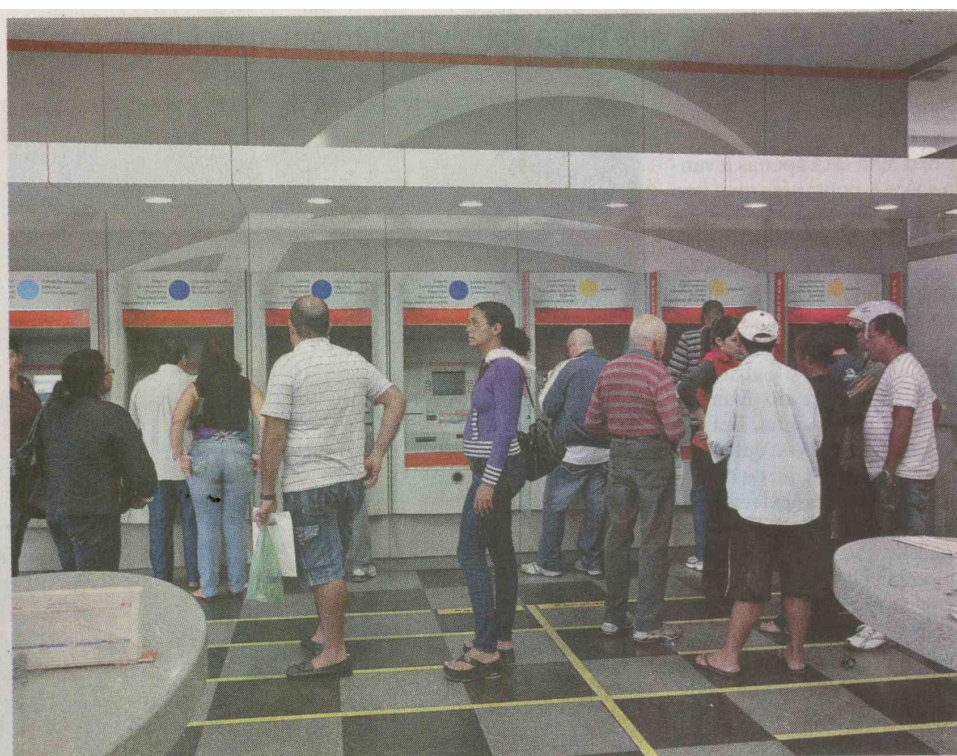
população é contra a volta do imposto do cheque, defendido pelos secretários como alternativa à saúde

Ele diz que antes da criação da CPMF o Governo poderia fazer esforço para aprovar a Emenda Constitucional 29. Parada no Congresso, desde 2000, a proposta estabelece que a União invista 10% da arrecadação de impostos no setor. O projeto define ainda percentuais de 12% para os Estados e 15% para os municípios. Na maioria das cidades paulistas, o índice já é praticado.